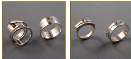
Deux jeux d'alliances conçus et réalisés par des élèves en Bijouterie-joaillerie.

Cette expérience a contribué à développer la culture entrepreneuriale auprès des élèves et fut une grande source de motivation pour ces derniers.