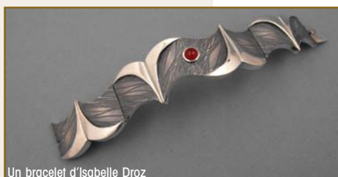
Un bracelet d'Isabelle Droz