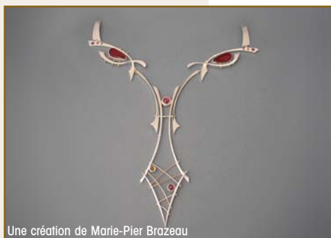
Une création de Marie-Pier Brazeau

Pour connaître les étapes de fabrication d'un bijou, visionnez la vidéo originale : « Un kangourou à Québec » sur Youtube.