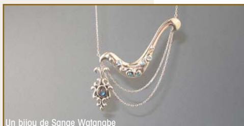
Un bijou de Sanae Watanabe